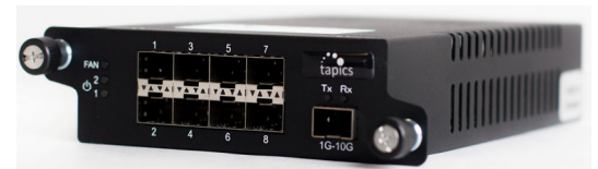
Jumper SP pour 8 ports de SPAN